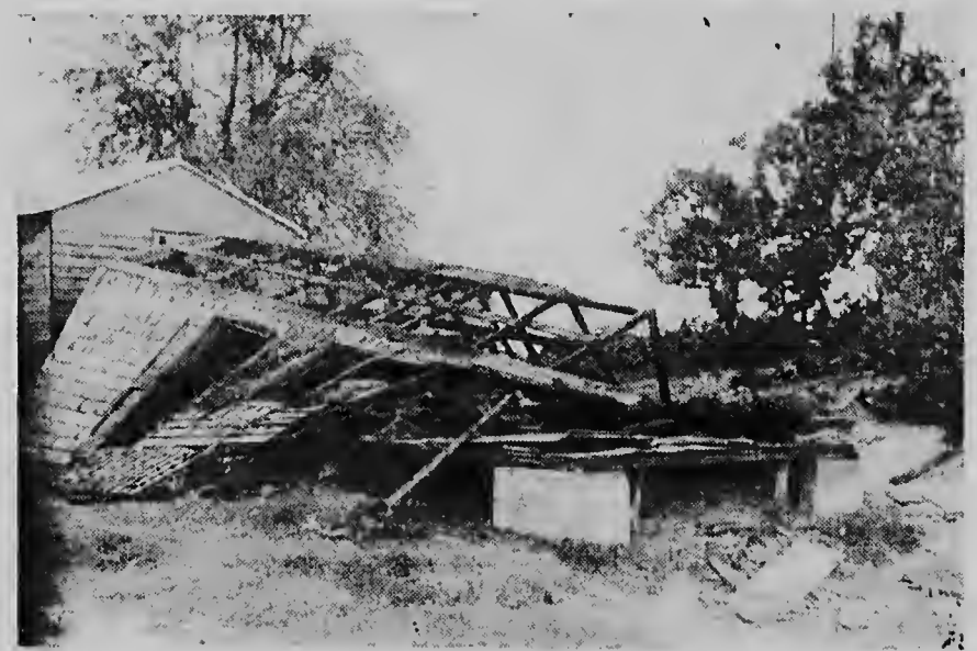
Ook huizen werden vernield en omvergewaaid, zoals hierboven.